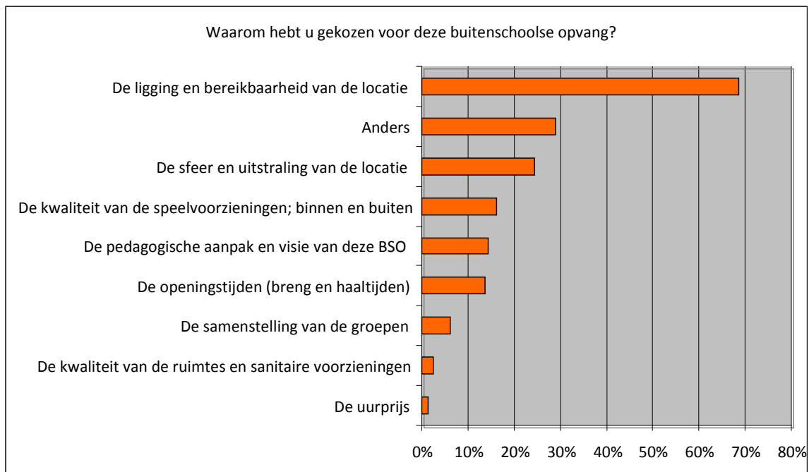
Figuur 1: Keuze voor BSO (meerdere antwoorden mogelijk)

Daarnaast worden door veel ouders andere motieven voor de keuze van de BSO genoemd. Meest genoemde motieven zijn: de samenwerking die de school met de BSO heeft (ze halen op van deze school, de BSO is aan de school verbonden, of op dezelfde locatie), de enige aanbieder in de woonplaats, dezelfde locatie als het KDV, enkele ouders noemen als motief voor de keuze dat de BSO sportfaciliteiten heeft.